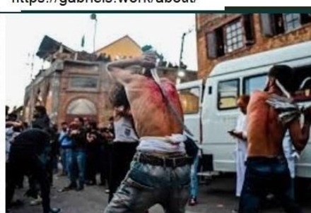
Flagelación, penitencia, crucifixión y el uso de... noticiasdebariloche.com.ar