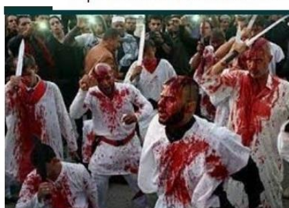
Ashura y Muharram; La Autoflagelación es ... articulo.islamoriental.com