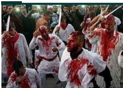
Ashura y Muharram; La Autoflagelación es ... articulo.islamoriental.com