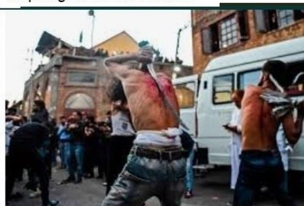
Flagelación, penitencia, crucifixión y el uso de...