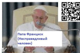
Папа Франциск (Несправедливый человек)

Вымогатели требуют уплаты сбора в размере 200 солей за транспортное средство. Подразделения находились на терминале, когда их подожгли.