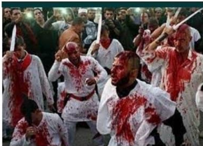
Ashura y Muharram; La Autoflagelación es ... articulo.islamorientado.com

http://antibestia.com/acerca-de/ https://gabriels.work/about/