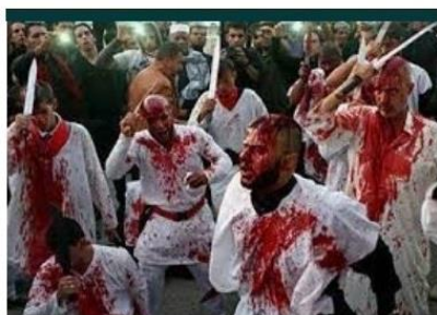
Ashura y Muharram; La Autoflagelación es ... articulo.islamorientado.com

http://antibestia.com/acerca-de/ https://gabriels.work/about/