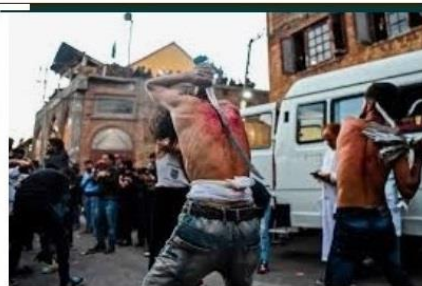
Flagelación, penitencia, crucifixión y el uso de... noticiadebariloche.com.ar