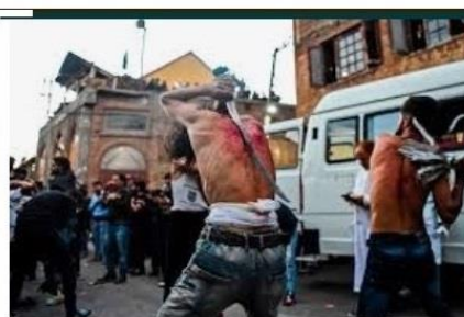
Flagelación, penitencia, crucifixión y el uso de...